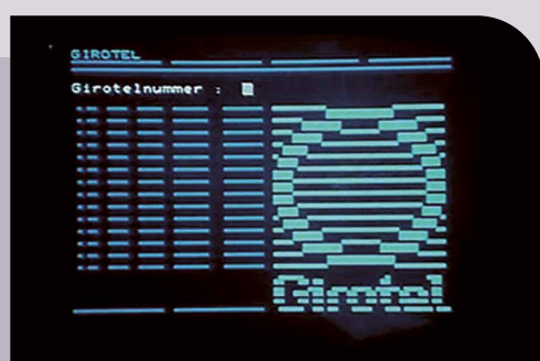
Girotel inlogscherm, 1986.

Girotel zou zich nog twintig jaar verder ontwikkelen als populair product. Niet in de laatste plaats door het bevoegen team achter het product. De populariteit groeide zeker ook door hun deelname aan populaire computerbeurzen waar abonnementen van Girotel met aantrekkelijk geprijsde modems gretig aftrek vonden. Menig computerhobbyist schafte het gewilde modem voor toegang tot bijvoorbeeld bulletin boards, e-mailen en surfen op internet aan bij de Postbank Girotelbalie. Het aantal particuliere en zakelijke Girotel-gebruikers veronderdovoudigde ongeveer vanaf 1988 (150.000 zakelijke abonnees in 2003). De komst en het gebruik van het internet deden Girotel groeien maar luidden ook het einde in. Online bankieren, internetbankieren via de MijnPostbank.nl website werden vanaf 2001 zo populair dat in 2008 definitief het doek valt. Postbank stopte met Girotel aan de vooravond van het samengaan van de banken Postbank en ING Bank onder één merk ING (2009). (Jacoline Bodewes & Theo Kamphuis, Conservatoren Bedrijfshistorisch Archief ING)