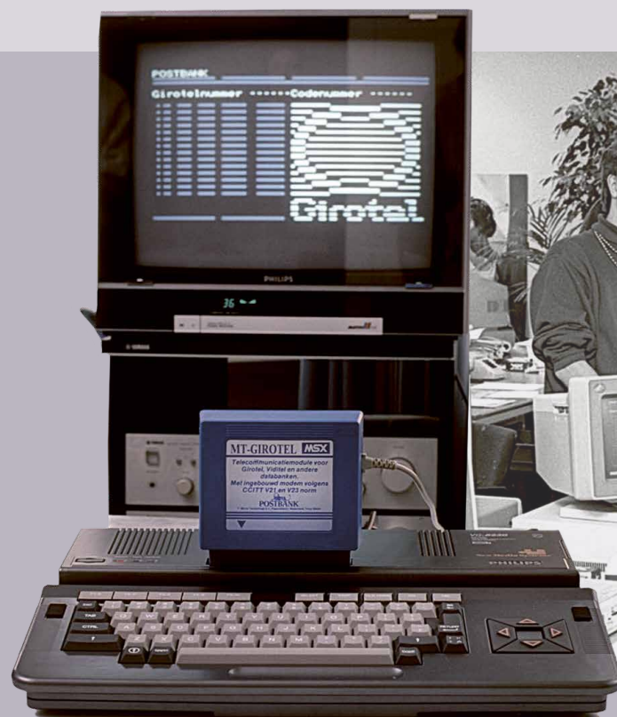
Philips MSX-DOS computer met MT-GIROTEL module, ca. 1990.