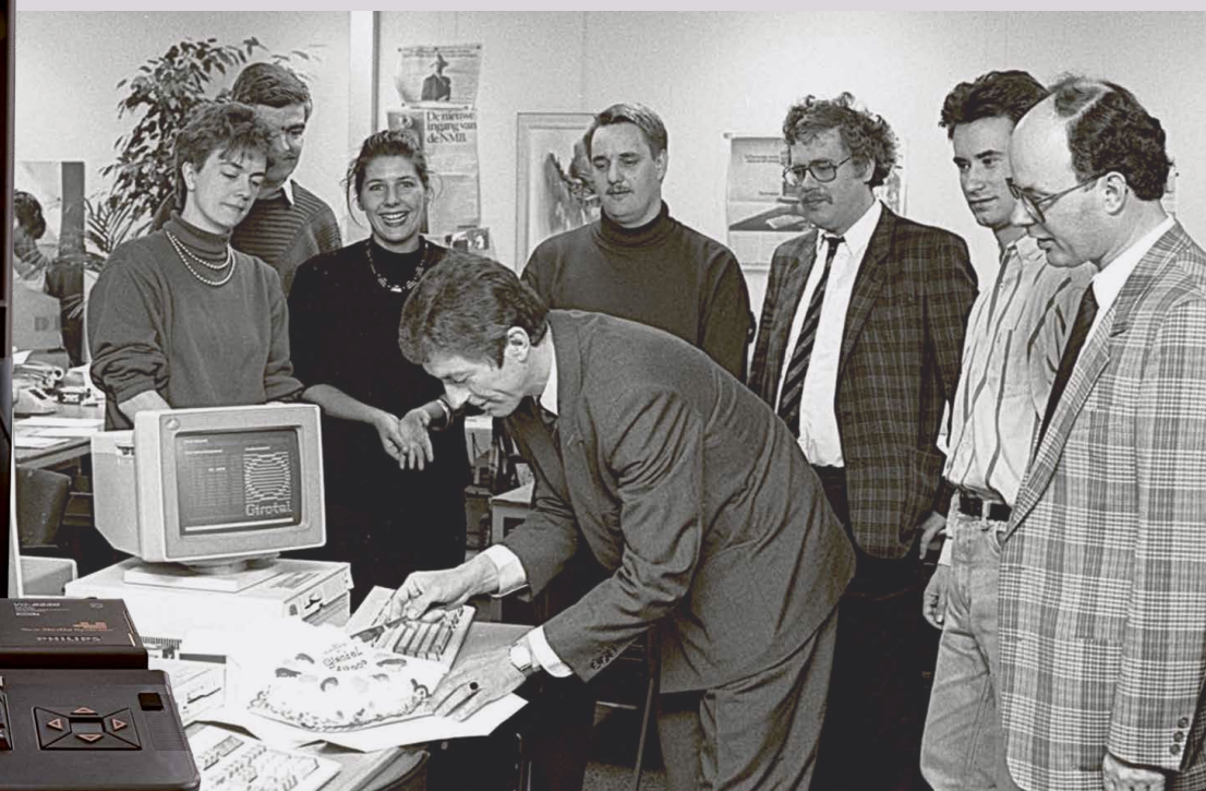
Feest bij het Girotel team voor van het 10.000ste abonnement.