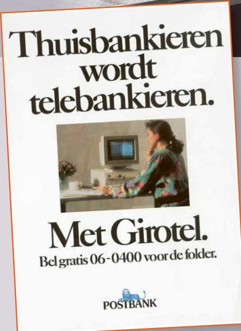
Affiche Girotel 'Thuisbankieren wordt Telebankieren.', 1990.

Girotel actief en waren er 2500 particuliere gebruikers, Girotel werd een permanent product in het Postbank dienstenpakket.