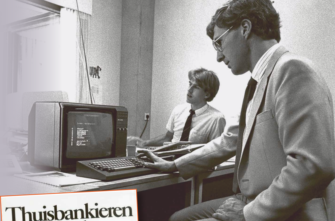
Het 'Girotel beheerscentrum' in het Postbank hoofdkantoor aan de Haarlemmerweg in Amsterdam, 1985.

Girotel op de proef gesteld Op 13 februari 1986 gaf J. Zijlstra, oud-president van De Nederlandsche Bank, het startschot voor Girotel. Op een persconferentie maakte hij via Girotel 100.000 gulden over naar het comité dat in 1992 de Olympische spelen in Amsterdam zou organiseren. Vanaf dat moment konden 1000 proefpersonen met gebruik van hun eigen home- of per-